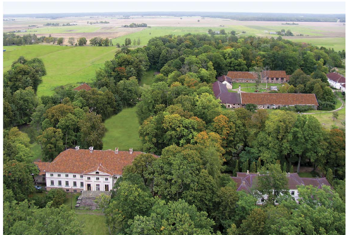
Барское поместье Айзупе. Фото 2007 года.