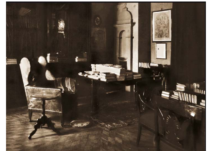
Рабочая комната. Фото 1924 года.