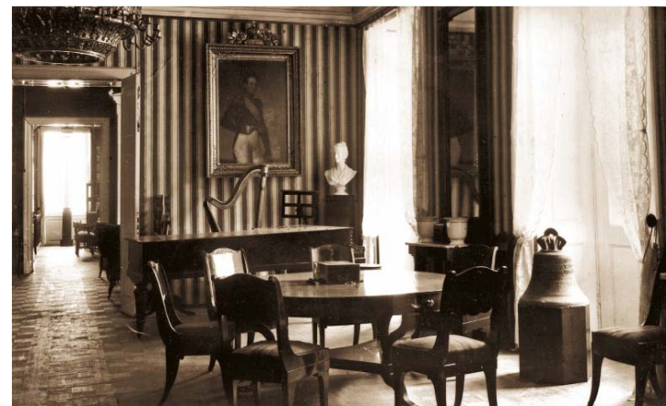
Зал. Фото 1924 года.