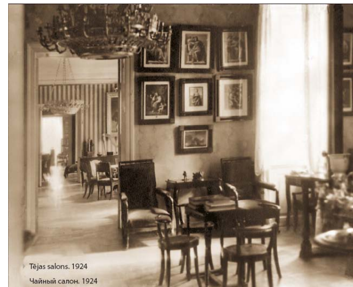
Чайная комната. Фото 1924 года.