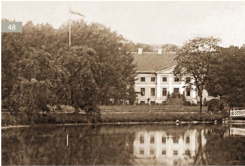
Барский дом поместья Айзупе со стороны пруда. Фото начала 20 – ого столетия.

гражданской войны, но и самое тяжелое испытание: аграрную реформу 1920 года. Это по существу было не испытанием, а полным и окончательным крахом системы помещичьих усадеб и культуры помещичьих усадеб. Даже в том случае, когда бывшие владельцы могли оставить себе барский дом или даже дворец, они были полупустыми, непригодными к новым условиям обитания и бедноте. Айзупе было единственным поместьем, о котором Хайнц Пиранг в своей работе Das baltische Herrenhaus в 1928 году мог написать: «...принадлежит к немногим барским домам, которые полностью пощадила война. Также сохранилась внутренняя обстановка. Художественно проникновенные и почтительные владельцы считали важным ничего не менять в обстановке унаследованного дома. Каждый предмет занимает то же место, как это было во время бабушки». Как позже о состоянии дома в 30 – тые годы 20 – ого столетия писал Андре фон Хаан, «не хватает лишь чернил в чернильнице, в остальном же все осталось так, как мой прадедуска со своей супругой обустроил в Айзупе».