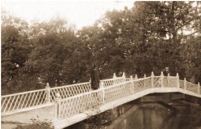
Мостик над прудом. Фото начала 20 – ого века.

гражданской войны, но и самое тяжелое испытание: аграрную реформу 1920 года. Это по существу было не испытанием, а полным и окончательным крахом системы помещичьих усадеб и культуры помещичьих усадеб. Даже в том случае, когда бывшие владельцы могли оставить себе барский дом или даже дворец, они были полупустыми, непригодными к новым условиям обитания и бедноте. Айзупе было единственным поместьем, о котором Хайнц Пиранг в своей работе Das baltische Herrenhaus в 1928 году мог написать: «...принадлежит к немногим барским домам, которые полностью пощадила война. Также сохранилась внутренняя обстановка. Художественно проникновенные и почтительные владельцы считали важным ничего не менять в обстановке унаследованного дома. Каждый предмет занимает то же место, как это было во время бабушки». Как позже о состоянии дома в 30 – тые годы 20 – ого столетия писал Андре фон Хаан, «не хватает лишь чернил в чернильнице, в остальном же все осталось так, как мой прадедуска со своей супругой обустроил в Айзупе».