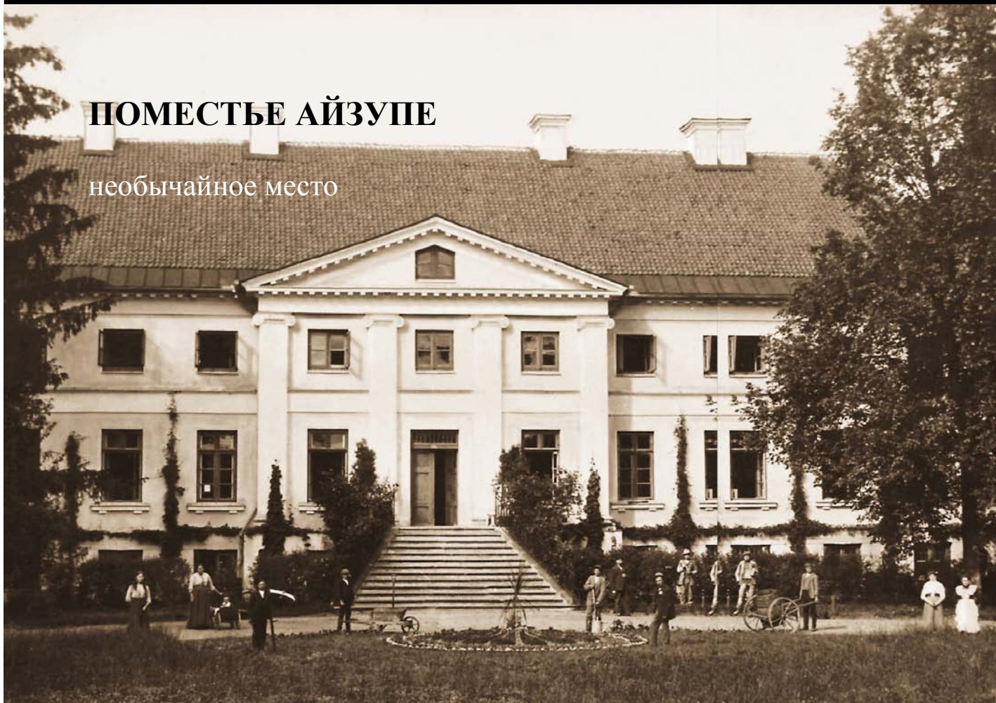
Фасад двора. Фото начала 20 – ого столетия.