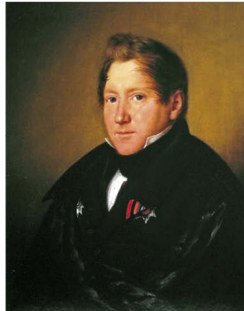
Портрет: Первый барин майората поместья Айзупе Поль фон Хаан. Портрет неизвестного художника, 20 – годы 19 – ого столетия.