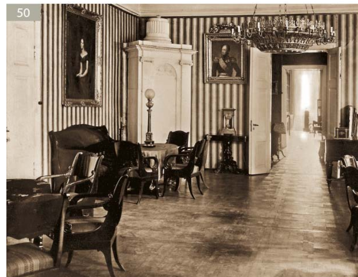
Зал. Фото 1924 года.