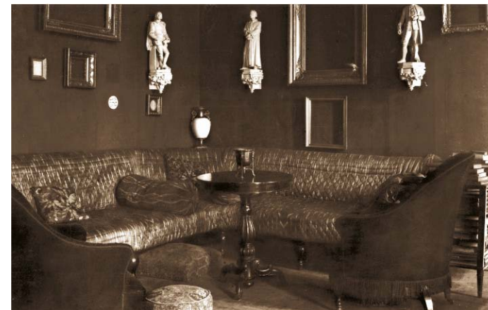
Красный салон (диванная комната). Фото 1924 года.

Столовая была помещением, которое соответствовало традициям быта начала 19 – ого века, которые под влиянием английской моды воспринимали трапезу как торжественный ритуал. Любимой составной частью столовых тех времен была ниша буфета, которую обычно отделяли колоннами. Отдельные двери, ведущие на кухню, позволяли незаметно вносить блюда в помещение и расставлять их на буфет перед сервировкой на стол. Самым роскошным воплощением этой идеи в Латвии была столовая дворца Межотне, в которой две пары колонн разделяют оба конца зала.