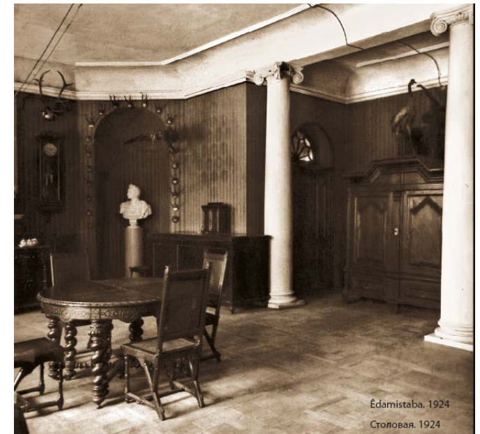
Столовая. Фото 1924 года.

Принятое в 1985 году решение о переносе техникума в Огре оказалось для поместья Айзупе роковым. Покинутым зданием не смогли управлять ни Талсинское, ни Тукумское лесные промышленные хозяйства, которым оно по очереди принадлежало. Надежды вернуть к жизни бывший центр поместья вселили планы немецкой фирмы GUT Agram GmbH по созданию в Айзупе центра обучения и квалификации предприятий в сельском